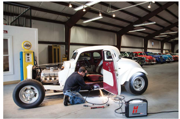
Reparación y modificación de vehículos